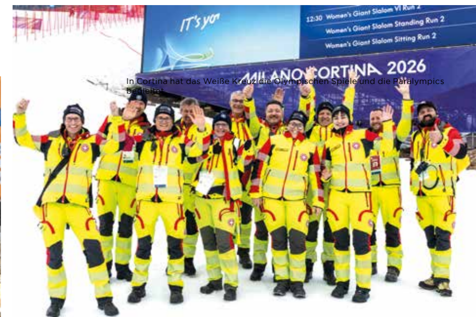
In Cortina hat das Weiße Kreuz die Olympischen Spiele und die Paralympics begleitet.