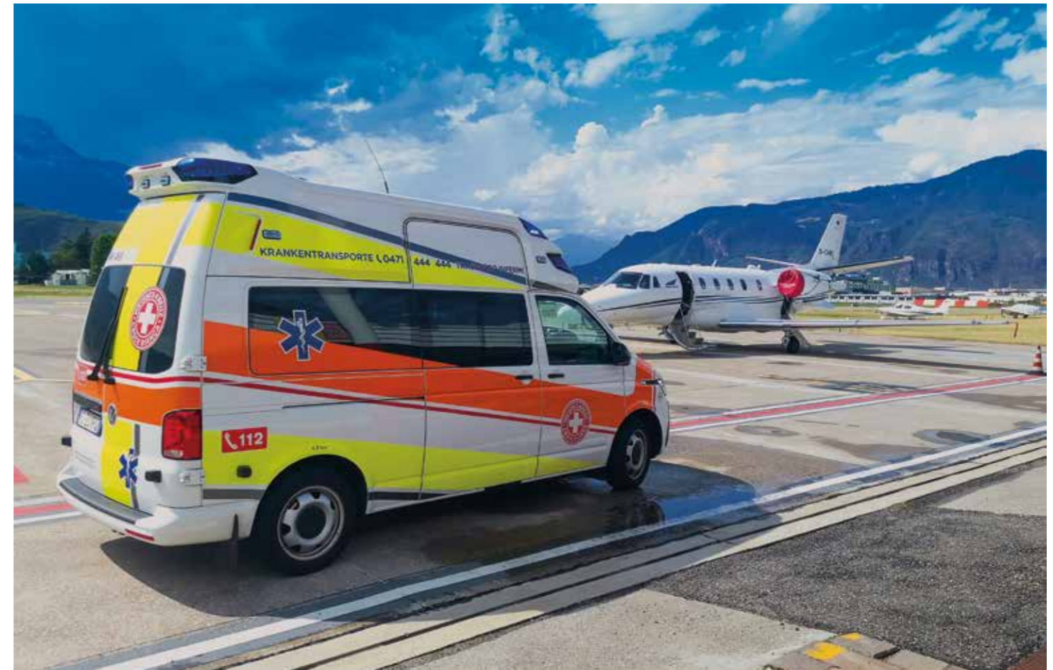
Sollte es im Urlaub wirklich zu Verletzungen kommen, reagiert das Weiße Kreuz sofort und organisiert die Rückreise mit sicheren Transportmitteln.