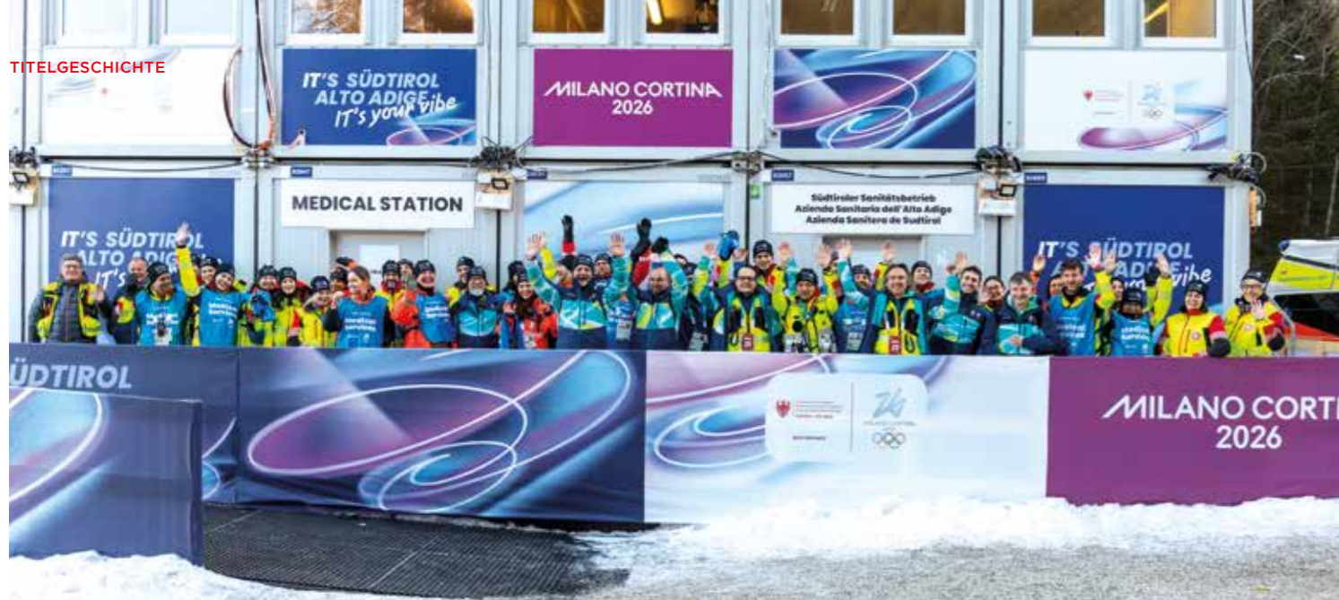
Ein Einsatz der Superlative für das Weiße Kreuz: Über 1.200 Freiwillige aus dem ganzen Land waren mit viel Professionalität und Herz bei den Olympischen Spielen dabei.