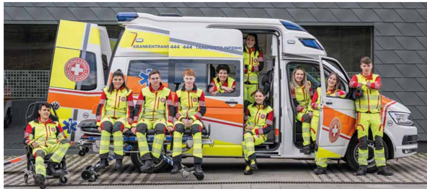
Berufliche Kompetenzen, Erfahrungen sammeln und Freundschaften knüpfen: 40 junge Menschen leisten derzeit den Zivildienst beim Weißen Kreuz.