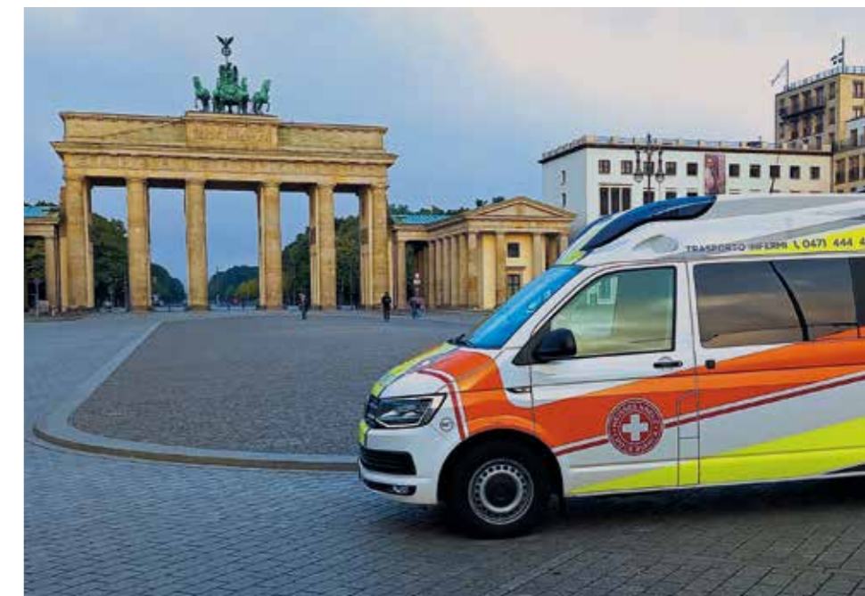
Ob Paris oder Berlin, ob Asien oder Amerika: Der Schutz durch die Mitgliedschaft Weltweit+ des Weißen Kreuzes gilt überall.