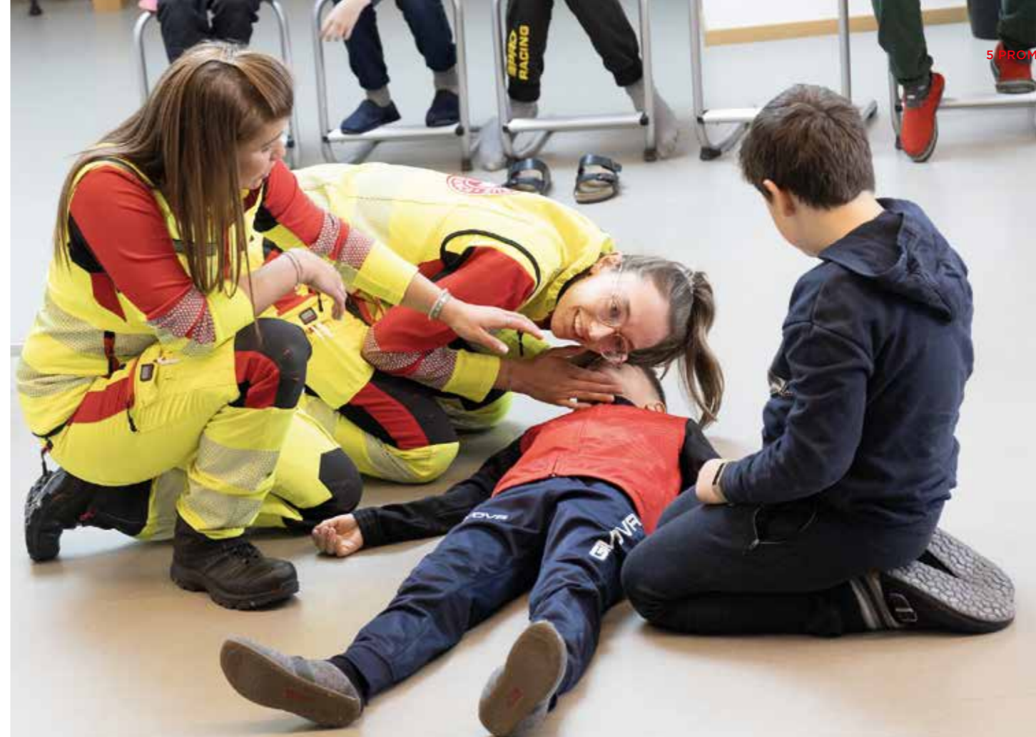
Nach einer kurzen theoretischen Einführung dürfen die Kinder und Jugendlichen alle Handgriffe selbst ausprobieren.

Ergänzt wird der theoretische Teil durch praktische Übungen: Die Schülerinnen und Schüler lernen, einen Notruf abzusetzen, Verbände anzulegen, kleine Wunden zu versorgen oder eine Person in die stabile Seitenlage zu bringen. „Dadurch vertiefen sie nicht nur ihr Wissen, sondern lernen auch, Gefahrensituationen zu erkennen und richtig zu reagieren“, so Schmid. Komplexe Inhalte werden dabei bewusst ausgeklammert, um die Kinder weder zu über-