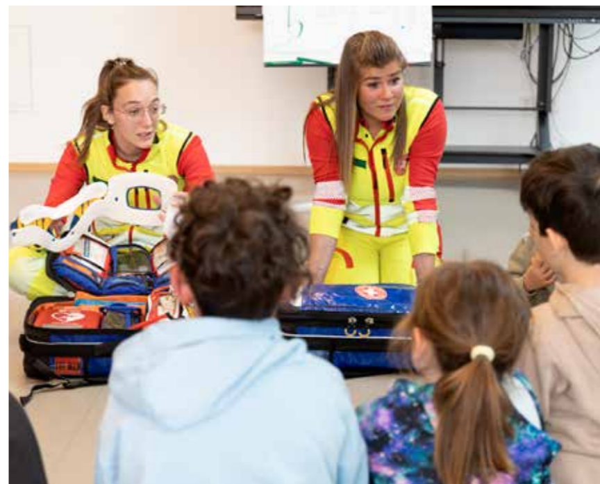
Der Erste-Hilfe-Unterricht wurde als Pilotprojekt entwickelt und gehört jetzt an vielen Schulen zum Unterrichtsstoff.

Je mehr Menschen in Südtirol grundlegende Erste-Hilfe-Maßnahmen kennen, desto engmaschiger wird das Netz der Hilfe im Notfall. Wer weiß, was zu tun ist, kann rasch eingreifen und die Zeit bis zum Eintreffen der Rettungskräfte überbrücken. Deshalb ist es dem Weißen Kreuz seit jeher ein großes Anliegen, Erste-Hilfe-Wissen in Südtirol zu verbreiten.