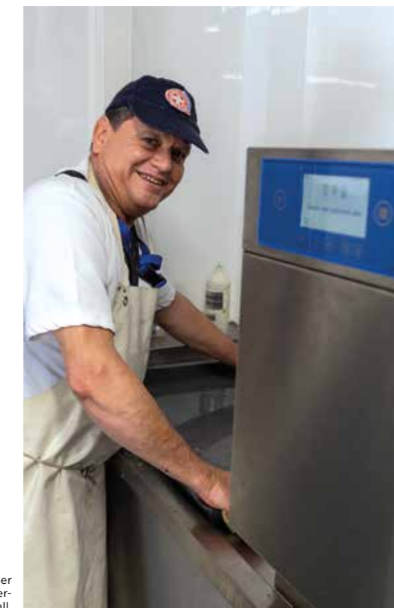
Der neue Funktionscontainer erlaubt eine noch schnellere Versorgung im Katastrophenfall.

Der Container leistet zudem einen wichtigen Beitrag zur Schonung wertvoller Ressourcen: Durch ein System zur Wärmerückgewinnung arbeitet er besonders energieeffizient und wassersparend. Außerdem kann dadurch Einweg-Geschirr durch wiederverwendbare Teller, Besteck und Gläser ersetzt werden.