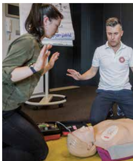
Der Einsatz des Defibrillators erhöht die Überlebenschance bei einem Herz-Kreislaufstillstand deutlich.

Mit den 5-Promille-Zuweisungen unterstützt die Südtiroler Bevölkerung wichtige Projekte des Weißen Kreuzes. Die Mittel fließen direkt in moderne Ausrüstung, Ausbildung und Initiativen, die im Notfall den entscheidenden Unterschied machen – und damit allen Menschen im Land zugutekommen.