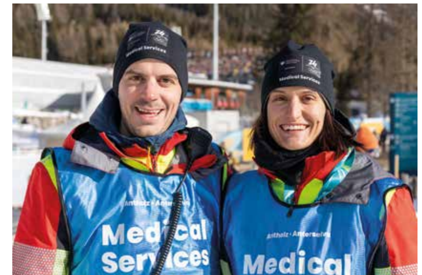
Mitten im Geschehen: Die Freiwilligen beim Sanitätsdienst an der Rennstrecke in Antholz.