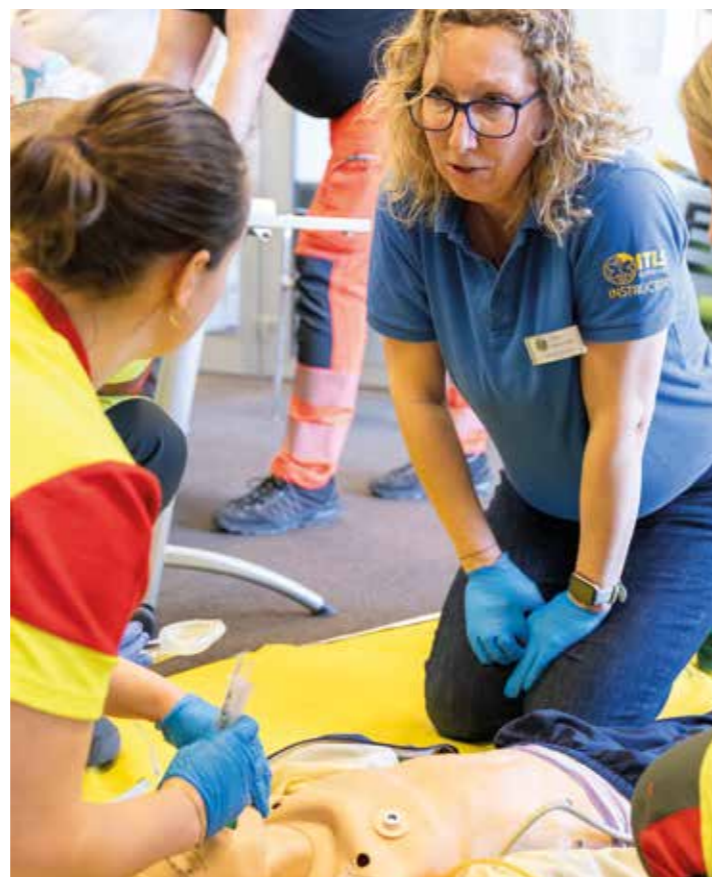
Das weltweit anerkannte Ausbildungsprogramm hilft den Rettungskräften, die Verletzungen am Unfallort gut einzuschätzen und entsprechend zu behandeln.

In praxisnahen Trainings lernen Sanitäterinnen und Sanitäter, Verletzungen am Einsatzort rasch einzuschätzen und entsprechend zu behandeln - etwa durch Atemwegsmanagement, Schockbehandlung oder Immobilisation. /sr