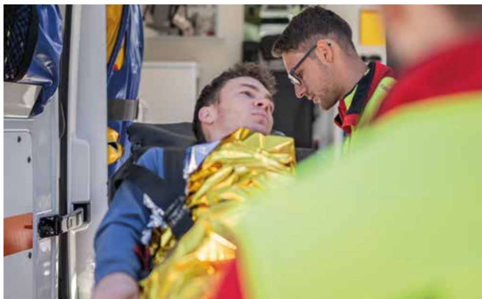
Mit Monitoren überwachen Rettungskräfte kontinuierlich die Vitalwerte und können auf Veränderungen sofort reagieren.

Notfallmonitore gehören zur wichtigsten medizinischen Ausrüstung im Rettungsdienst. Sie ermöglichen es, die Vitalwerte eines Patienten – etwa Herzrhythmus, Blutdruck oder Sauerstoffsättigung – kontinuierlich zu überwachen. Die Geräte sind speziell für den mobilen Einsatz konzipiert und begleiten Patientinnen und Patienten vom Einsatzort ins Krankenhaus. Damit können Rettungskräfte kritische Veränderungen des Gesundheitszustandes sofort erkennen und schnell reagieren. Dank der 5-Promille-Zuweisungen konnte das Weiße Kreuz zusätzliche Geräte ankaufen und damit eine optimale Patientenversorgung sicherstellen.